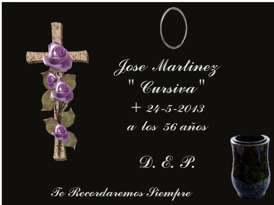
MOD. PR2825 CRUZ CON ROSAS INCRUSTACION CERAMICA COLOR JARRON GRANITO INSCRIPCION GRABADA