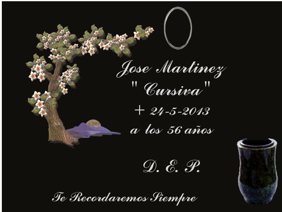
MOD. PR2504 ARBOL CON PISAJE INCRUSTACION CERAMICA COLOR JARRON GRANITO INSCRIPCION GRABADA